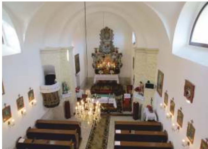
• Oltár v katolíckom kostole