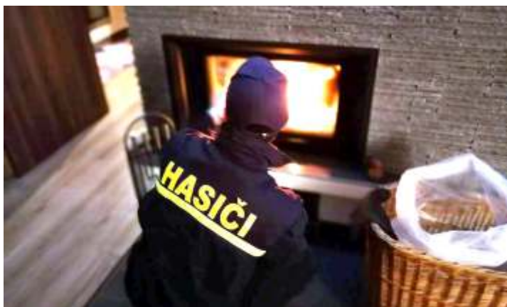
• Kontrola krbovej vložky v rodinnom dome