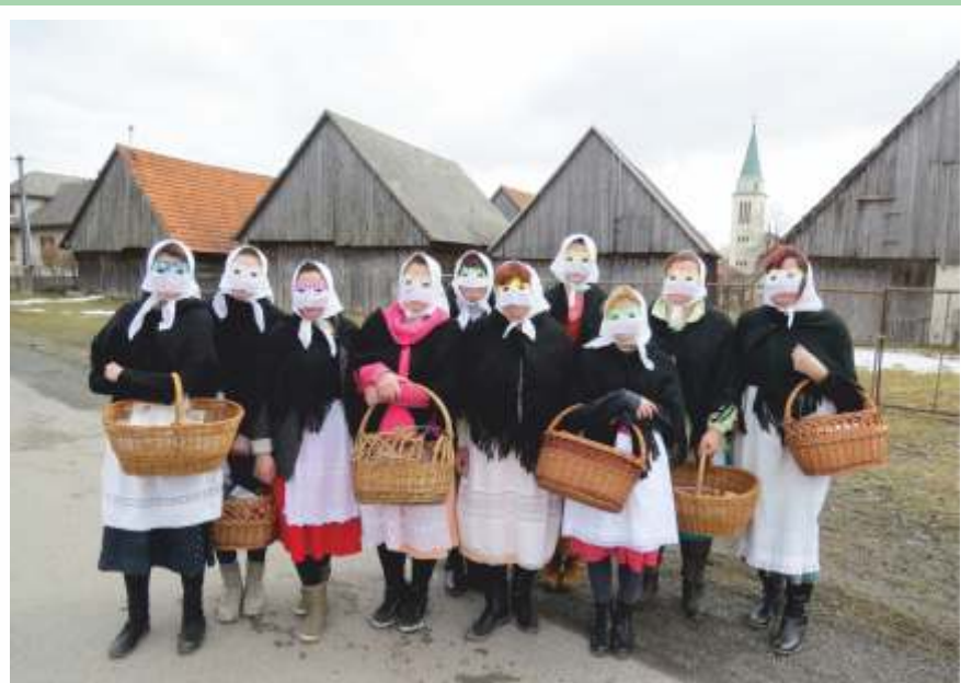
• Tradícia nosenia Marmurieny predchádza veľkonočným sviatkom