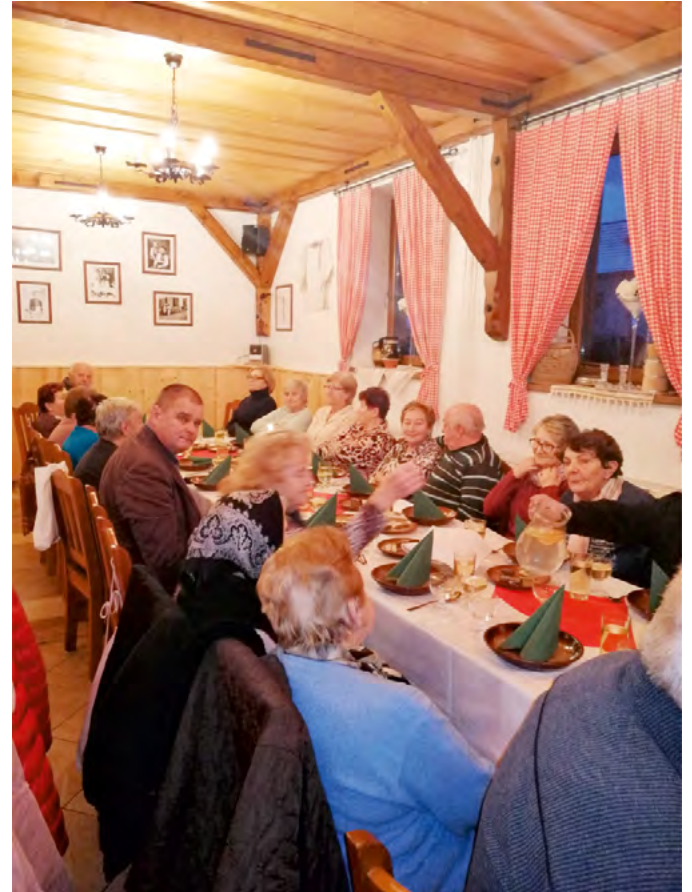
• Posedenie pri kapustnici