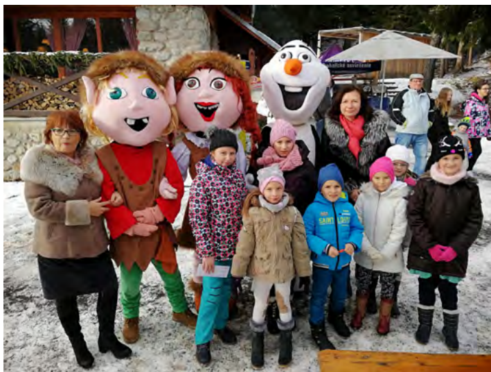
• členmi JDS, zabezpečili kultúrny program pre hotel Pieris a Permon na Podbanškom