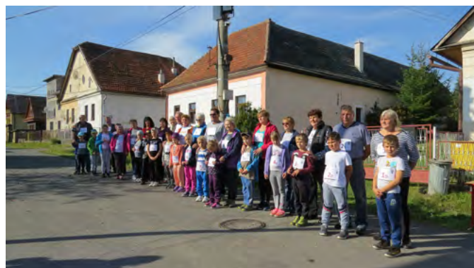
• Starí rodičia spolu s adoptívnymi starými rodičmi a ich vnukmi pred štartom behu na 1 km