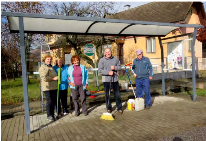
• Čistenie autobusových zástavok už tradične robia členovia JDS

Blíži sa koniec roku 2019 a pred nami je rok 2020. Nuž a na konci roka sa zvykne bilancovať a do nového roka si dávame rôzne predsavzatia. Nebudem vymenovávať všetky aktivity, ktoré sme v tomto roku uskutočnili, zmienim sa len o ich počte. Rôznych kultúrno-spoločenských a športových aktivít bolo v tomto roku spolu 33, ktorých sa zúčastňovali členovia JDS v počtoch od 4 až po 70. Pri čistení obce, vypratávaní podkrovia kultúrneho domu, čistení autobusových zástaviek, na cintoríne, pri Urbárskom dome a urbárskych garážach, na RD sme uskutočnili 16 brigád za účasti od 3 až do 28 členov, podľa toho, koľko si situácia vyžadovala.