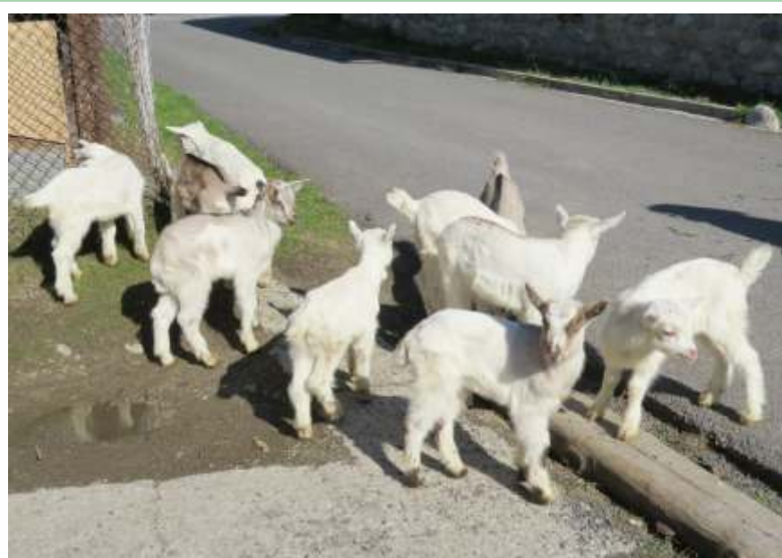
• Kozliatka, jeden so symbolov Veľkej noci