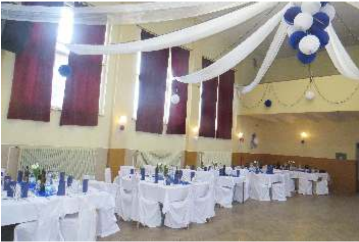
• Dôstojne upravená sála