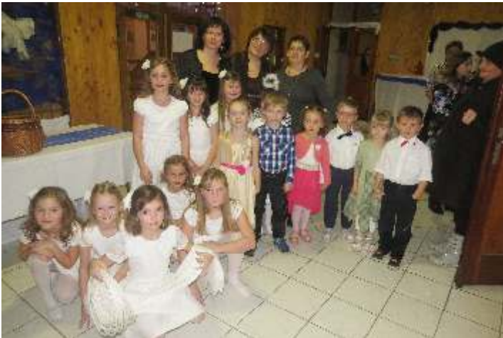
• Účastníkov plesu pozdravili deti zo ZŠ s MŠ