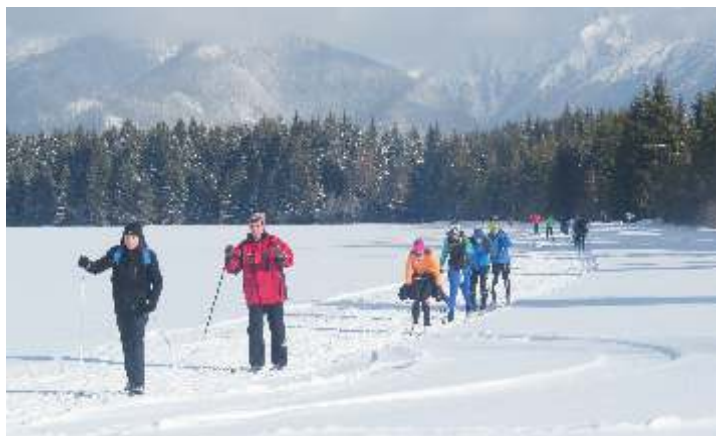
• Januárový lyžiarsky pochod