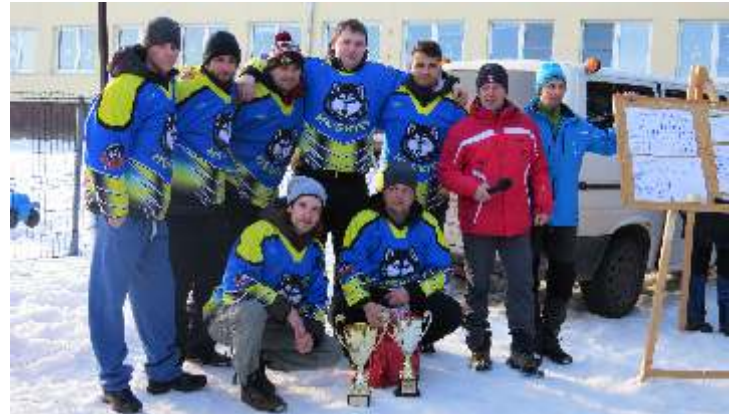
- Kokavská zimná olympiáda na zjazdovke