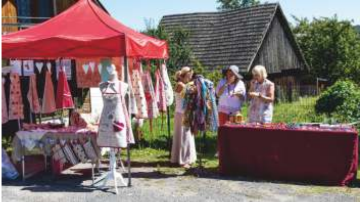
• Aj po roku sa jarmočníci vrátili do našej obce