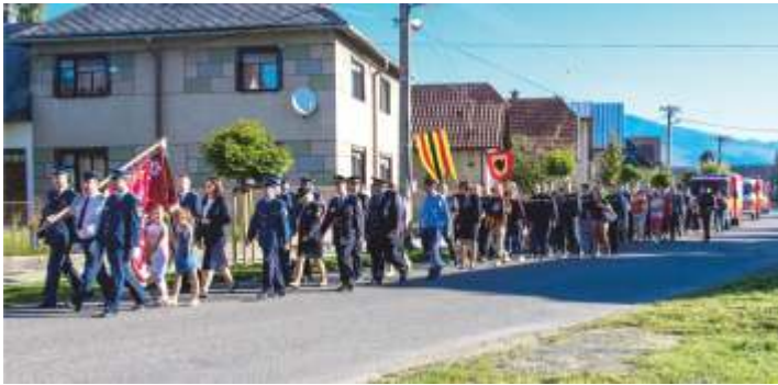
• Slávnostný sprievod hasičských jednotiek našou obcou

Margetaja poďakovať všetkým, ktorí sa podieľali na príprave, či už členom DHZ ale aj iným. Každému družstvu ďakujeme za účasť a dúfam, že budúci rok sa nám táto akcia vydarí opäť, aspoň tak ako tento rok!