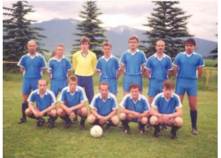
Sezónna 1995 - 1996