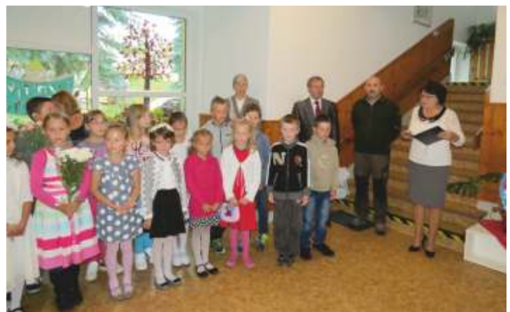
• Začiatok školského roka

Letné prázdniny plné slnečných dní sa skončili a začal sa školský rok 2016/2017. Pre našich prváčikov prvý, pre štvrtákov posledný v našej škole a pre druhákov a tretíakov taký - ako tie ostatné. Dva mesiace prázdnin plné zážitkov, sladkého „ničnerobenia“, prešli do spomienok. Žiaci načerpali nové sily, aby sa mohli venovať tomu, čo ich v škole každoročne čaká – vyzbrojiť sa vedomosťami a zručnosťami, poznávať nové pravidlá a zásady, ktorými sa budú riadiť v živote. Naša škola dáva priestor a možnosti rozvíjať záujmy a talent žiakov aj v záujmových útvaroch. Šikovné ručičky, Vlastivedno – turistický a Pohybovo – dramatický krúžok začnú pracovať od októbra. Žiakov v ZŠ i detí v MŠ čaká v tomto školskom roku rad podujatí kultúrneho aj športového charakteru, súťaže a množstvo iných aktivít, ktoré už majú v našej škole tradíciu. Škola je zase po 2 mesiacoch plná života, detskej vrapy, spevu a tanca, ako i napätia pred písomkou či skúšaním. Ale bude to najmä ďalších 10 mesiacov, keď sa s dôverou budete môcť obrátiť na svojich učiteľov, ktorí vám budú odovzdávať nové vedomosti, skúsenosti. Máte skvelých učiteľov, ktorí sú vždy pripravení podať Vám v pravej chvíli pomocnú ruku, dobrú radu či riešenie.