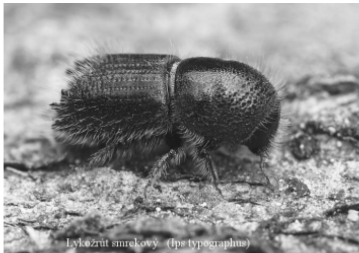
Lykožrút smrekový (Ips typographus)

podmienok pri plánovaných ťažbách a čerstvom dreve. Lepšie speňaženie takéhoto dreva nám pomáha dosiahnuť možnosť rozmanipulovať takéto „sucháre“ na našom sklade v areáli RD na sortimenty. Tieto sa dajú umiestniť na trhu s drevom za lepšie ceny ako kmene v celých dĺžkach. Treba len dúfať, že zimné mesiace prinesú dostatok snehových zrážok, ktoré pomôžu doplniť deficit vlhky v pôde a aj zima bude taká, aby mínusové teploty poriadne „podkúrili“ lykožrútomu.