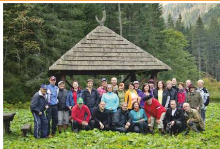
• Kokavský turisti v Tichej doline