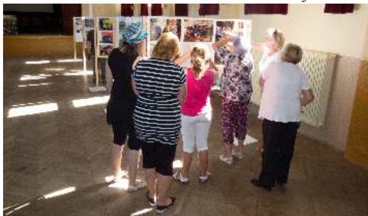
• Výstava historických fotografií bola jej návštevníkmi veľmi dobre hodnotená