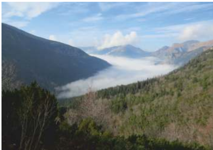
• Pohľad na Tichú dolinu