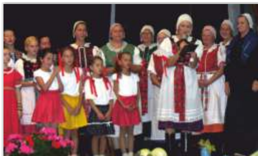
• Eudové zvyky