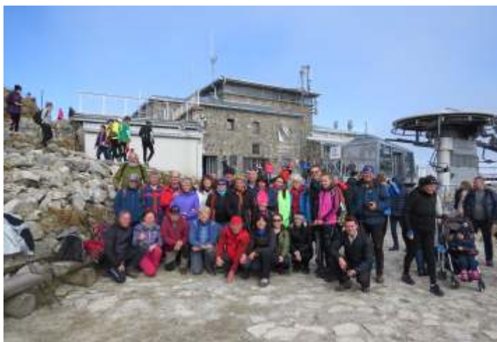
• Kasprov vrch