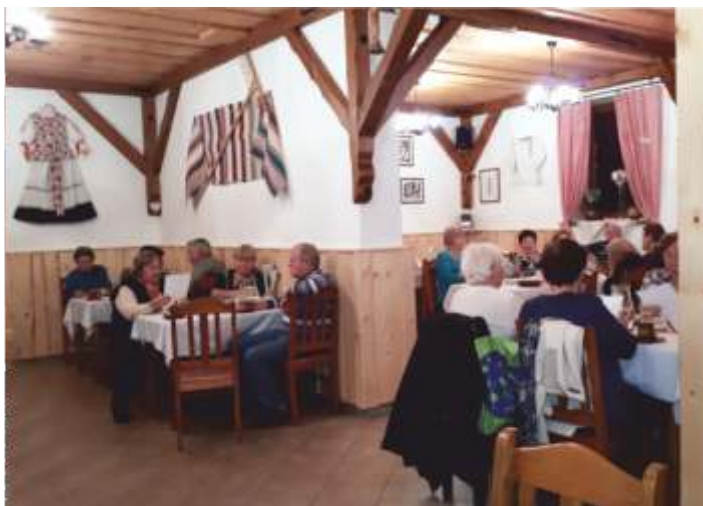
• Vianočné posedenie seniorov