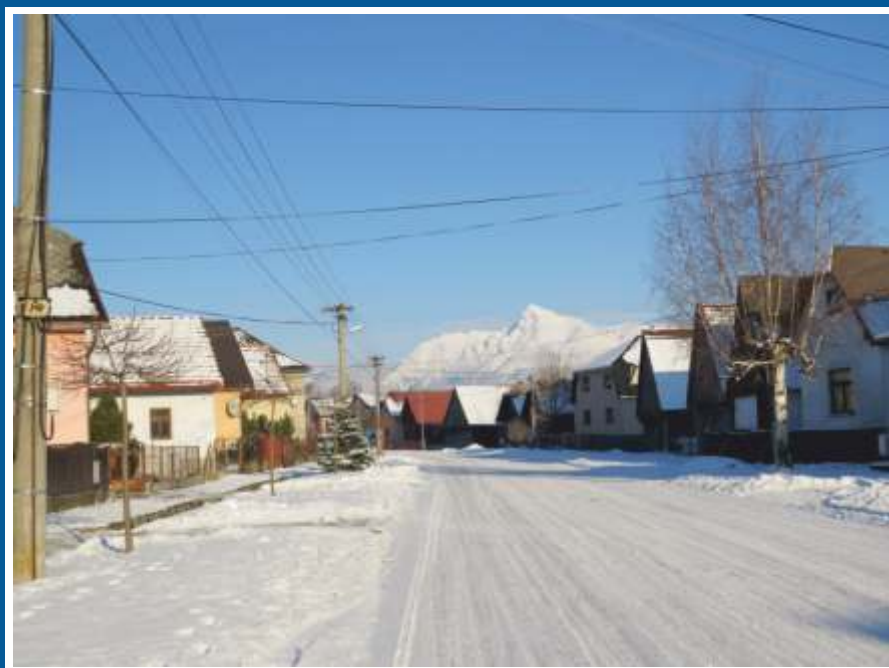
•Krásne predvianočné počasie v Liptovskej Kokave