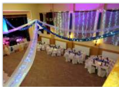
• Ples Rady rodičov pri ZŠ a MŠ