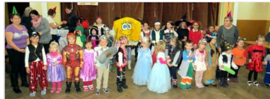
• Detský karneval