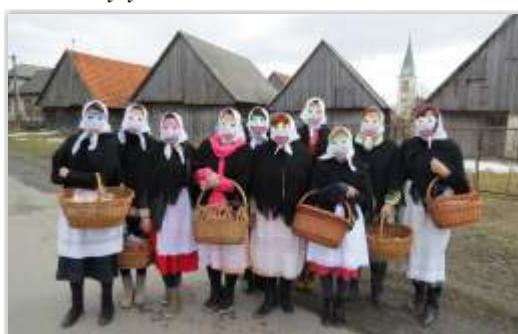
• Eudové zvyky