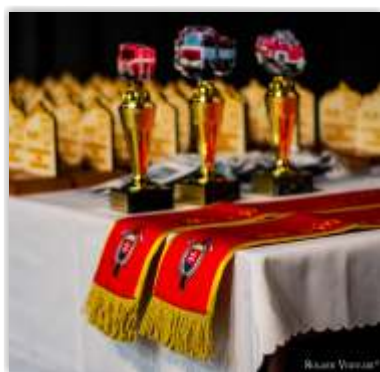
• 90. výročie založenia DHZ