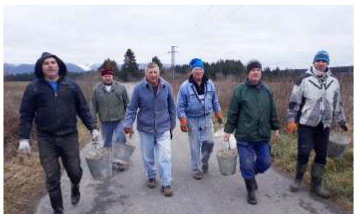
• Brigáda pri zbieraní skál nadšencov bežeckého lyžovania a mladých členov DHZ na trase lyžiarskej trate