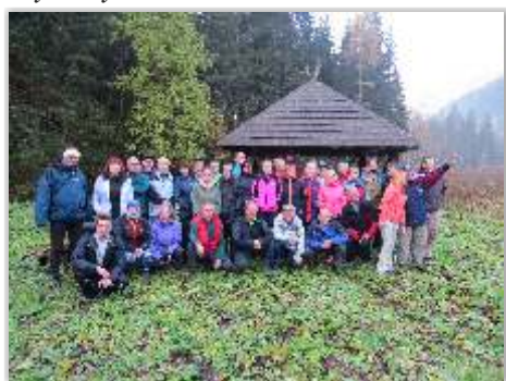
• Turistika v Západných Tatrách