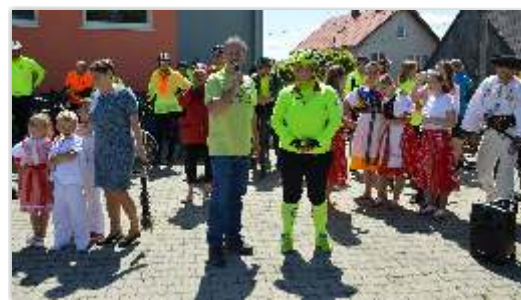
• Cyklomaratón Od Tatier k Dunaju