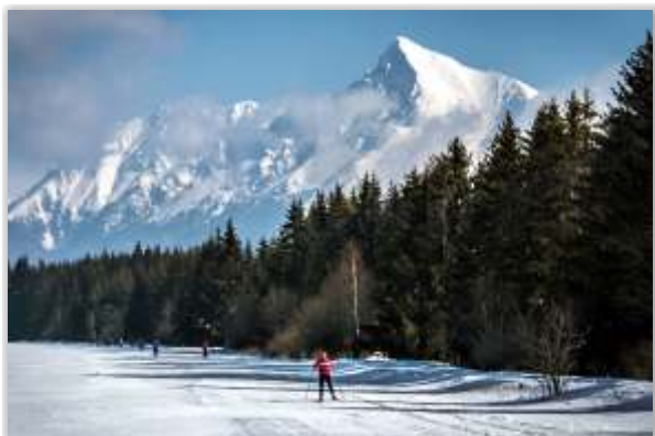
• Lyžiarsky deň