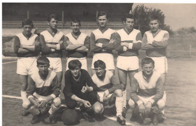
Zostava dorasteneckého družstva v ročníku 1965-1966