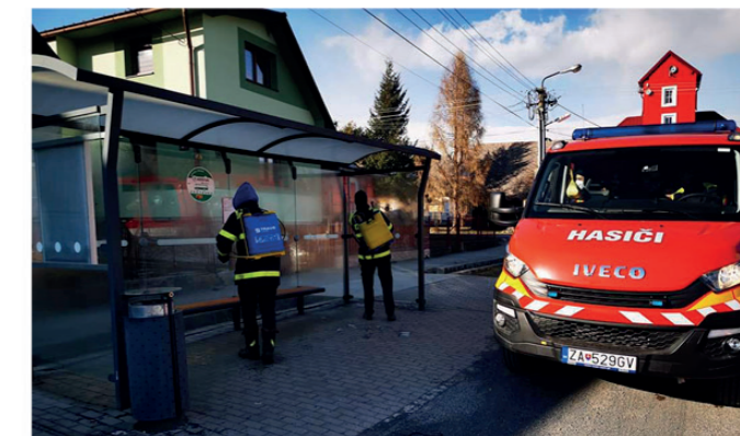
• Dezinfekcia autobusových zastávok

až do jej ukončenia spolu za DHZ Liptovská Kokava sme odslúžili 875 hodín a taktiež sme nezaháľali a na pokyn krízového štábu dezinfikovali verejné priestranstvá v našej obci.