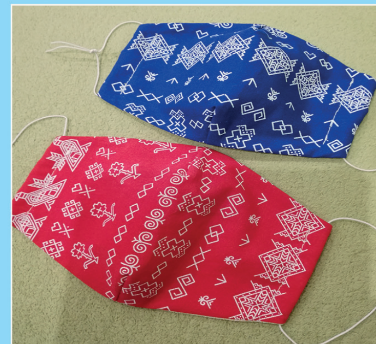
• Rok 2020 sa nesie v znamení ochranných rúšok proti infekčnému ochoreniu COVID 19 vyvolanému koronavírusom SARS-CoV-2